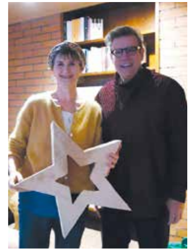
Das Hospiz soll weiterhin seinem Stern folgen, der es leitet und behütet.

Verlier den Stern nicht aus den Augen auch wenn alles um dich herum dunkel erscheint